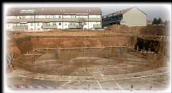
2006: inizio degli scavi