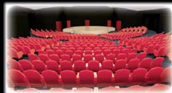
2008: si lavora agli interni