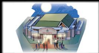
2005: il progetto